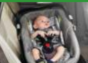
Автокресло «люлька» группы 0 (для детей массой < 10 кг)*

При покупке детского удерживающего устройства обязательно следует уточнить у продавца наличие сертификата на товар!